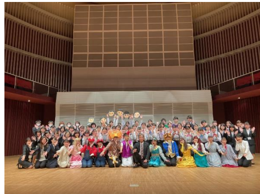
音楽部（長岡リリックホールで定期演奏会）