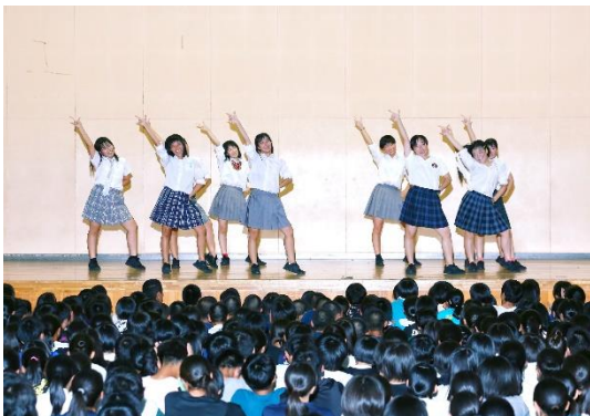
令和元年度 済美祭（文化祭）