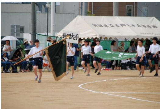
令和元年度 体育祭

今年度は、昨年度行うことができなかった体育祭や済美祭（文化祭）を行えるように仕事を全うするとともに、生徒会の活動を多くの人に広めていきたいです。