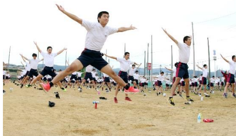
長岡大手高校の学校体操です。